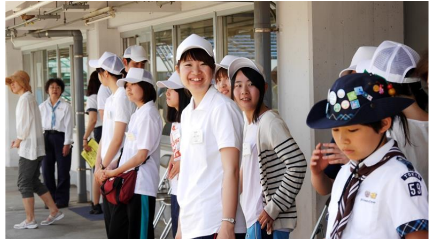
選手誘導のスタッフさん