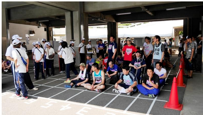
出番を待つ選手たち