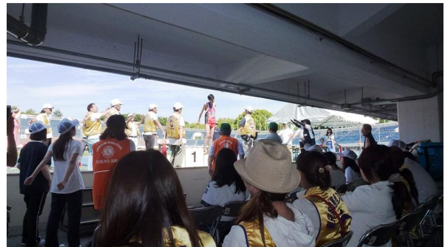
万歳要員、順番待ち