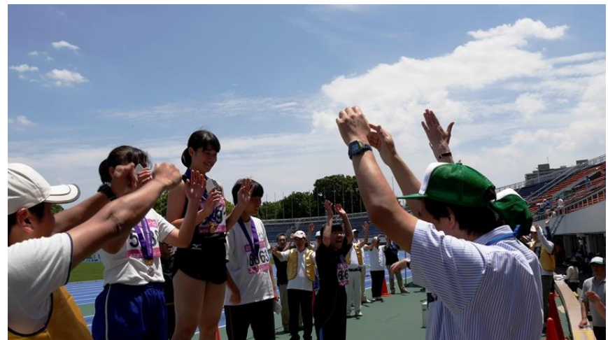
大きな万歳と 選手の小さなバンザイ