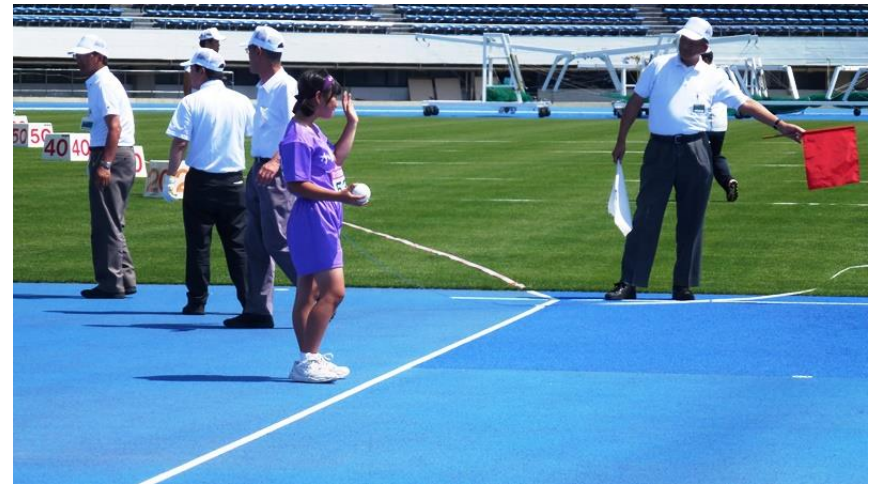
客席からの声援にこたえる女子選手