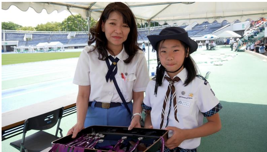
表彰式の準備できました