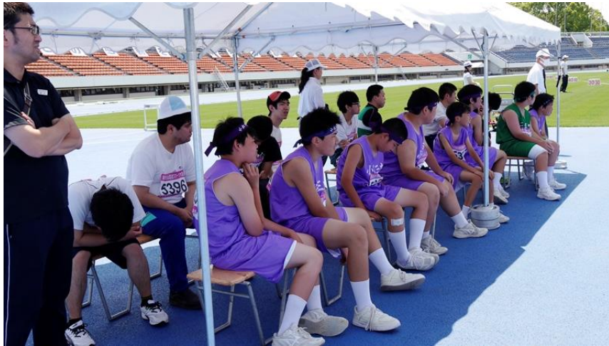
フィールド競技 ソフトボール投げ