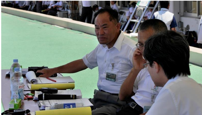
会場競技アナウンスのみなさん