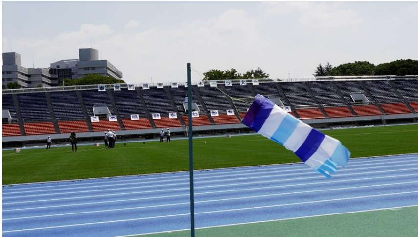
2日間 好天は久しぶり