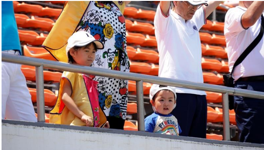
ちびっこの声援もありました