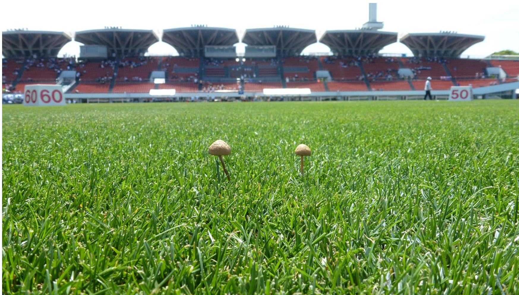
第 16 回 東京都障がい者スポーツ大会 写真レポート（作成：ライオンズクラブ国際協会 330-A 地区 広報委員会） 2015 年 5 月 30 日土曜日～31 日日曜日 駒沢オリンピック公園総合運動場陸上競技場