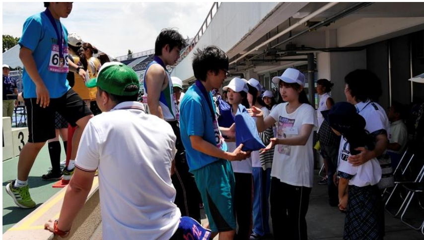
スパイクを渡します