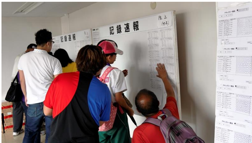
記録速報を見る家族