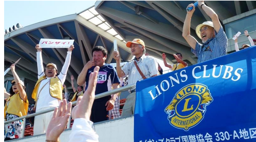
フィールドと会場がひとつに