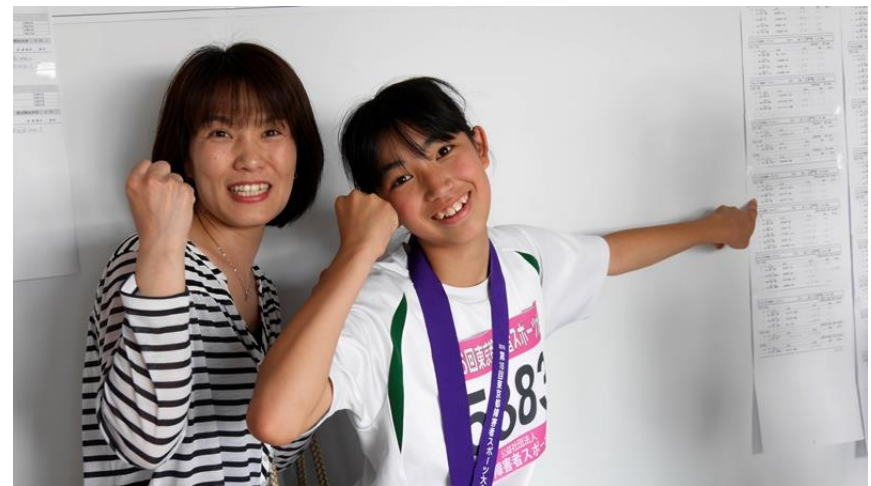
自己ベスト出ました