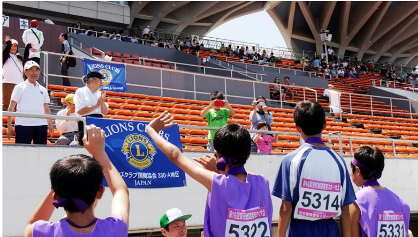
客席へ手を振る選手たち