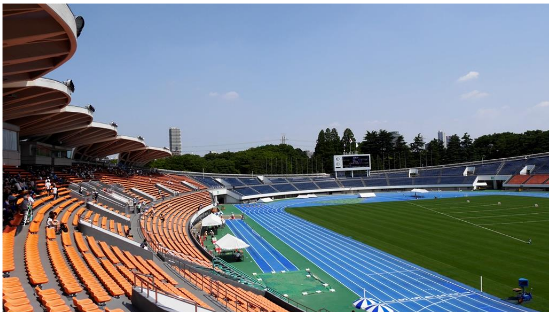
駒沢オリンピック公園総合運動場陸上競技場