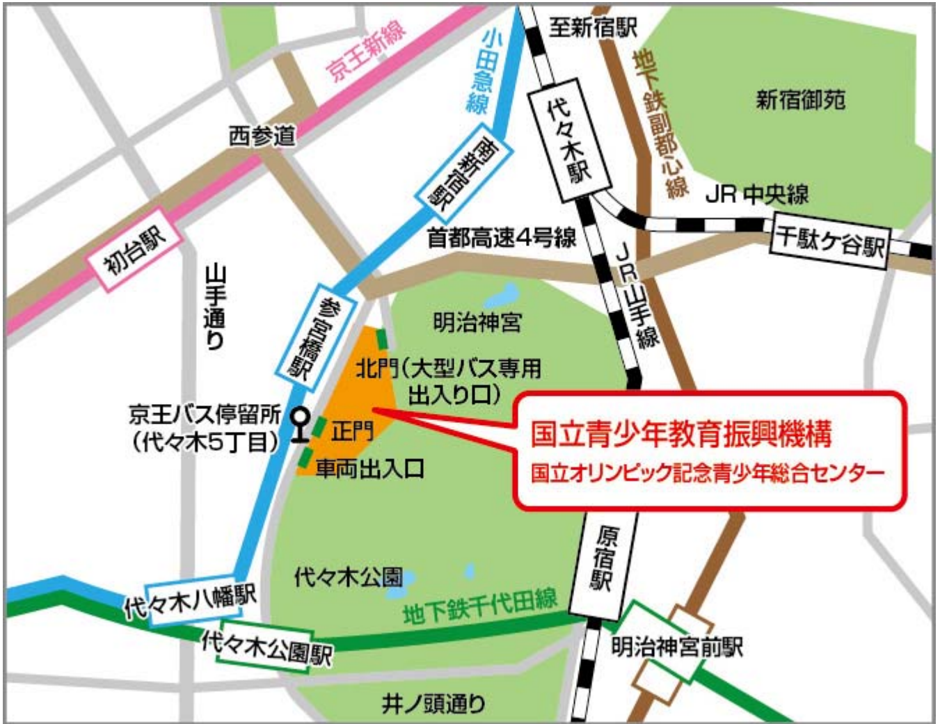
参宮橋からの[歩道橋]を使った経路