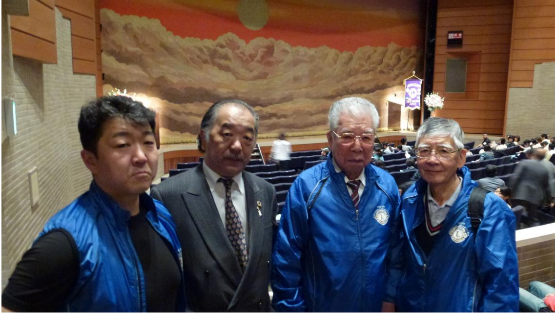
キャビネット 篠 幹事も駆けつけた