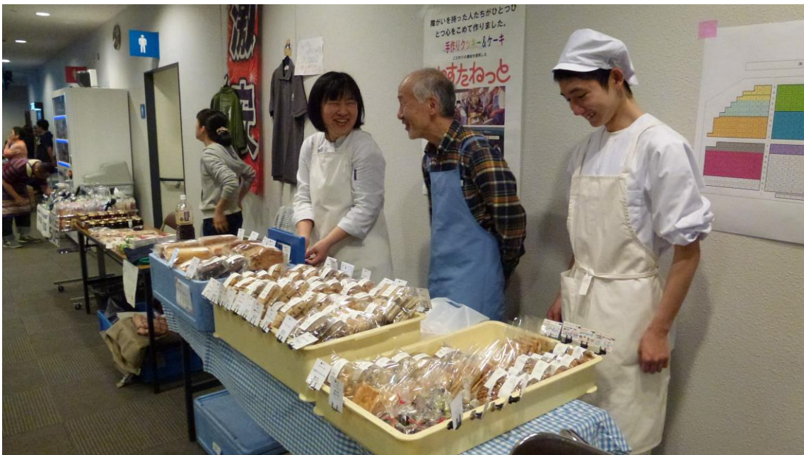
自主生産品の販売②