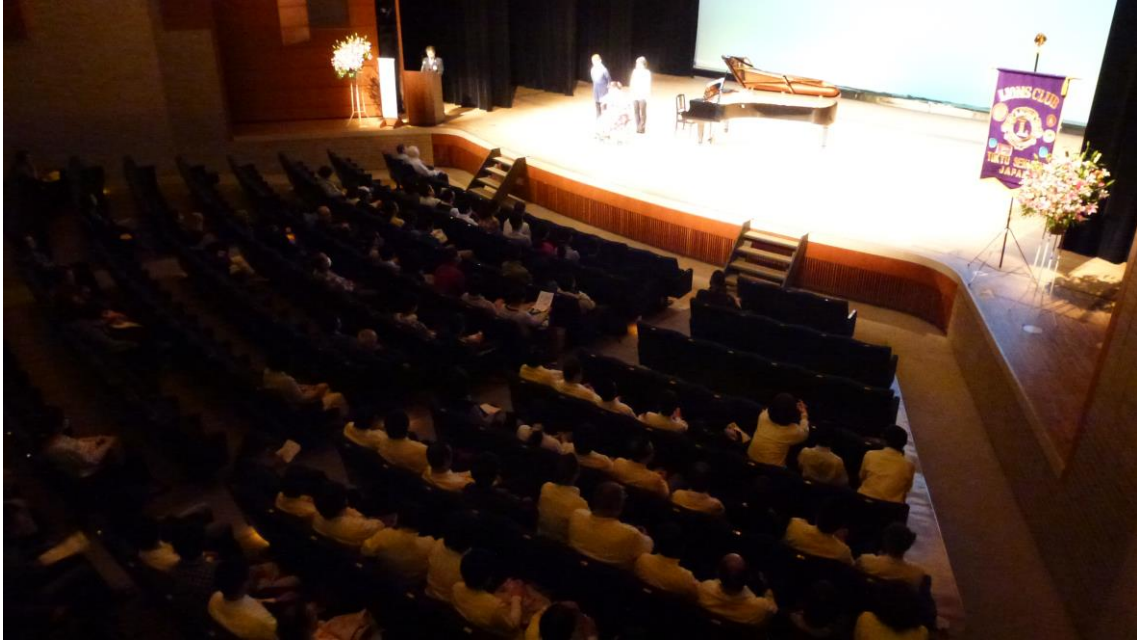
司会は L坂本 真路