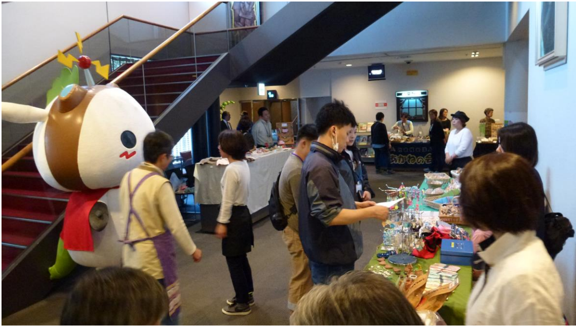
自主生産品の販売①