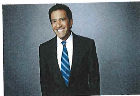
基調講演者 2018年7月1日（月曜日）

複数のエミー®賞を受賞したCNNの医療関連ニュースの特派員であり、現役の脳神経外科医。彼の医学研修と公衆衛生政策における経験ゆえに、戦場や自然災害現場からのその報道には際立つものがあります。より健康的で活動的な生活を送ることへの意欲をアメリカ人に起こさせることに情熱を抱いたグプタ医師は、「Fit Nation」という、複数のプラットフォームで配信されるCNNの肥満対策番組をスタートさせました。番組は今年で6年を迎えます。