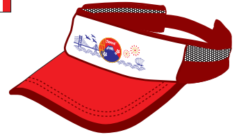
〈サンバイザー・側面〉