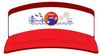
〈サンバイザー・正面〉