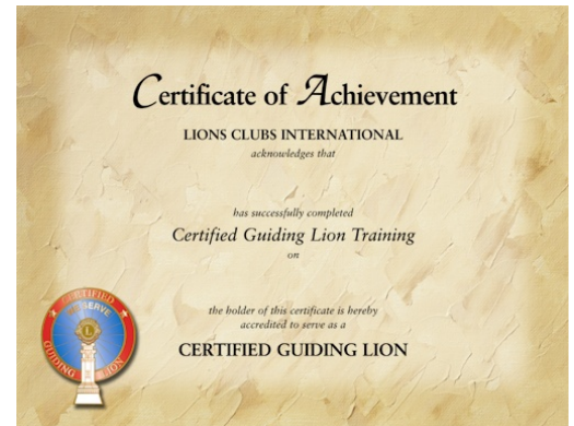
公認ガイディングライオン認定書

新クラブの支援やクラブ活性化のために開発された 国際協会公認・認定の重要な資格を取得出来ます！