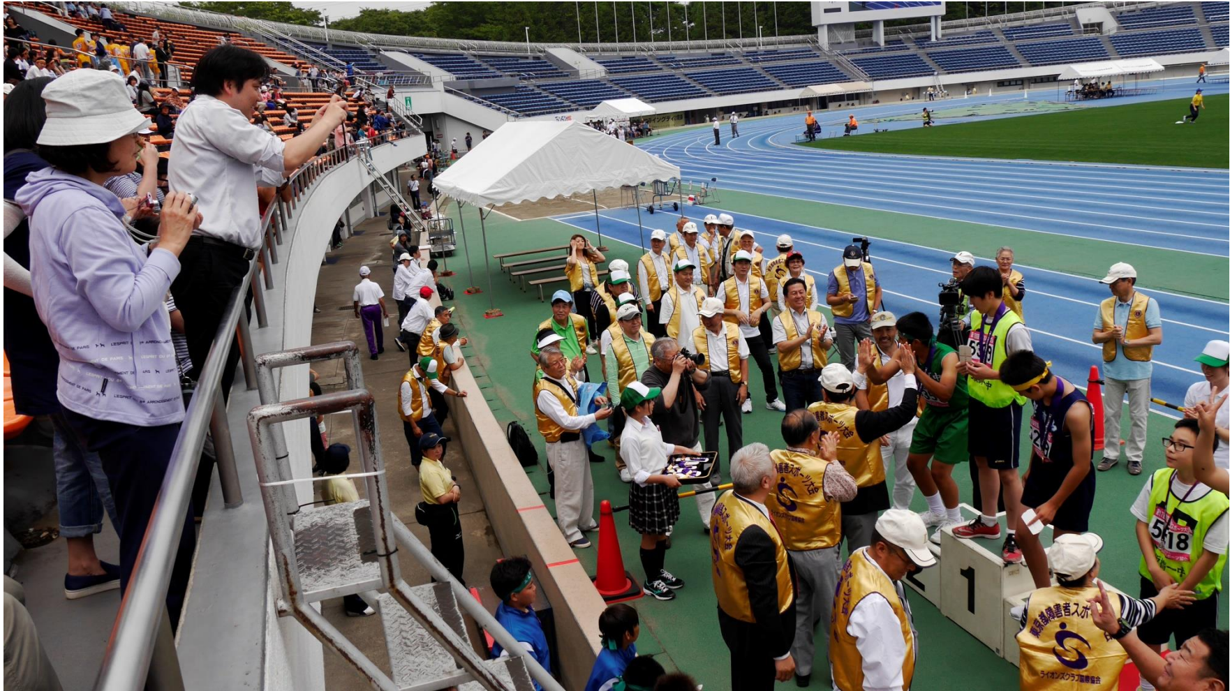
④ハイタッチ！よろこび表現中。