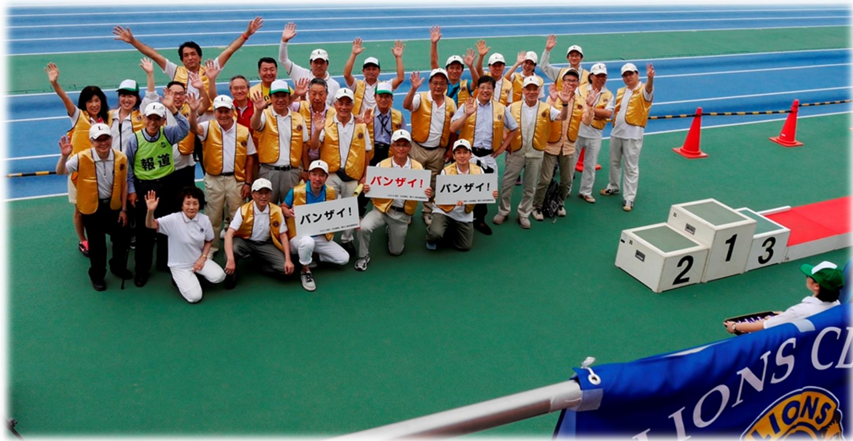
5.28.初日 最終の万歳前に