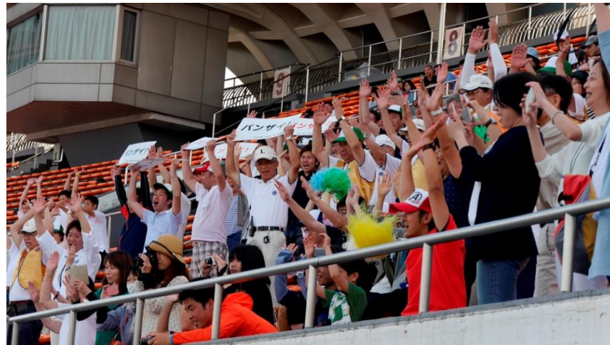
④⑩盛り上がります、やっぱり万歳。