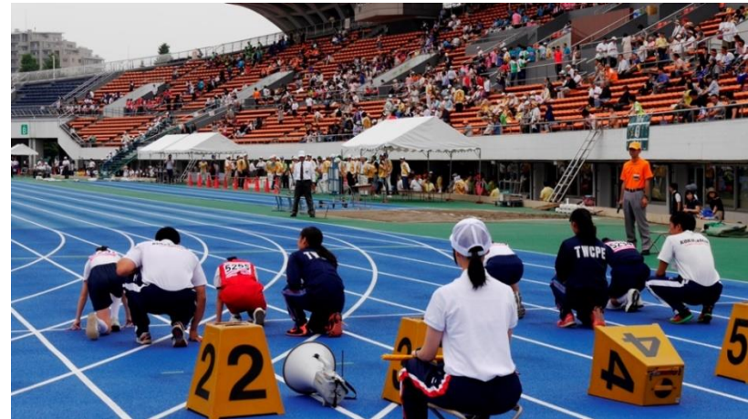
⑭さあ、スタートです