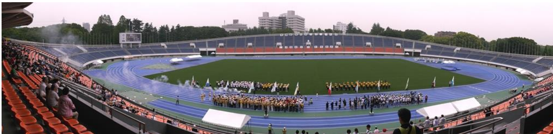
①開会式 炬火の入場