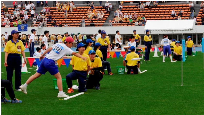
⑮フライングディスク アキュラシー