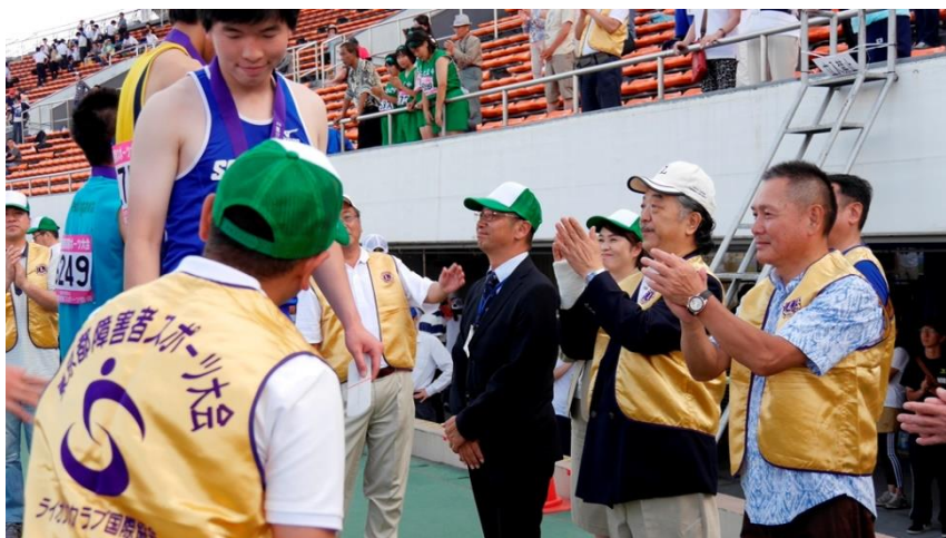
③⑤ 拍手のプレゼントもしっかりと