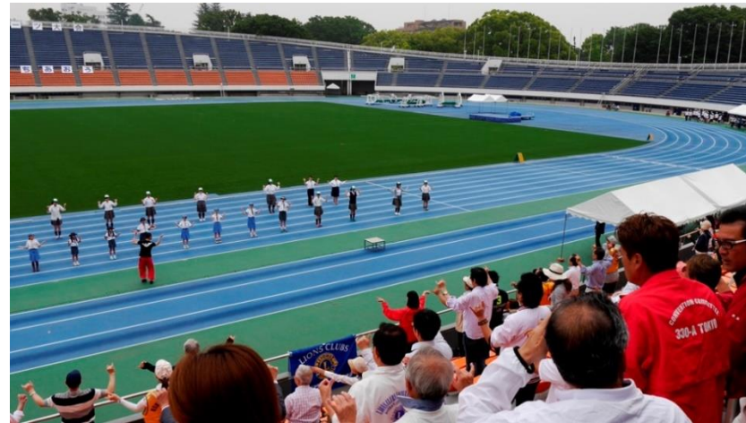
⑧リーダーと会場が一体になったの準備体操