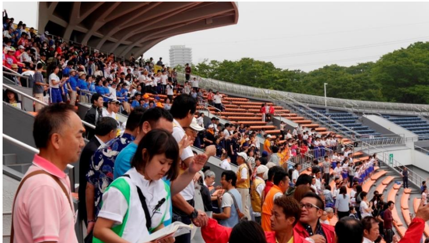
⑦準備体操始まります