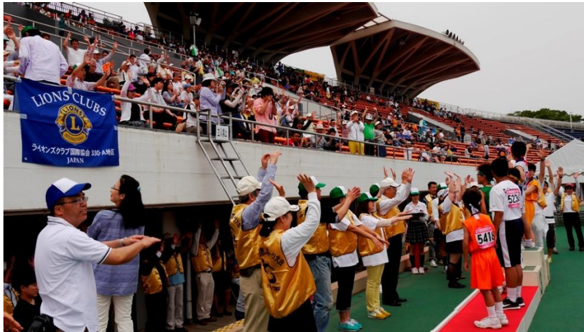
⑰表彰式・万歳始まりました