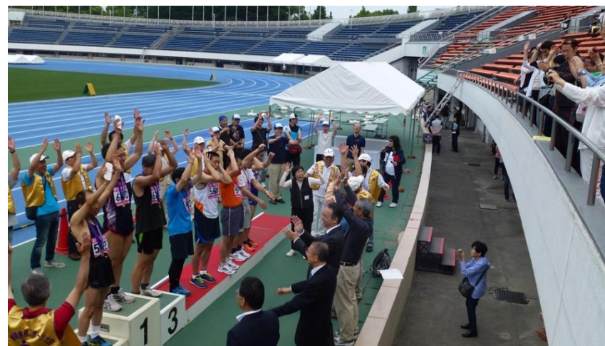
㊶客席に手を振って応えます