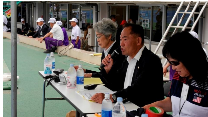
⑫競技開始のアナウンス