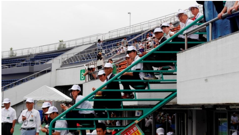
⑪ゴールの時計係のみなさん