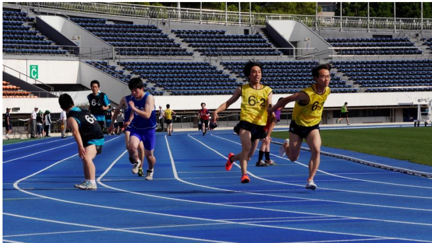
③⑨大会の華 100M×4 リレー