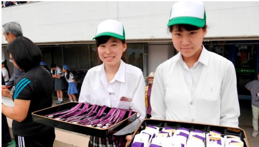
⑨表彰準備できました。笑顔もね！