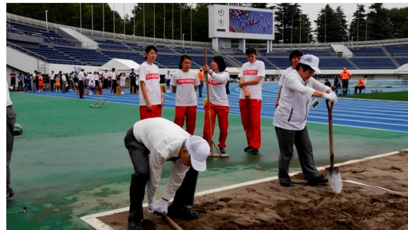
⑩砂場も柔らかく解（ホグ）します