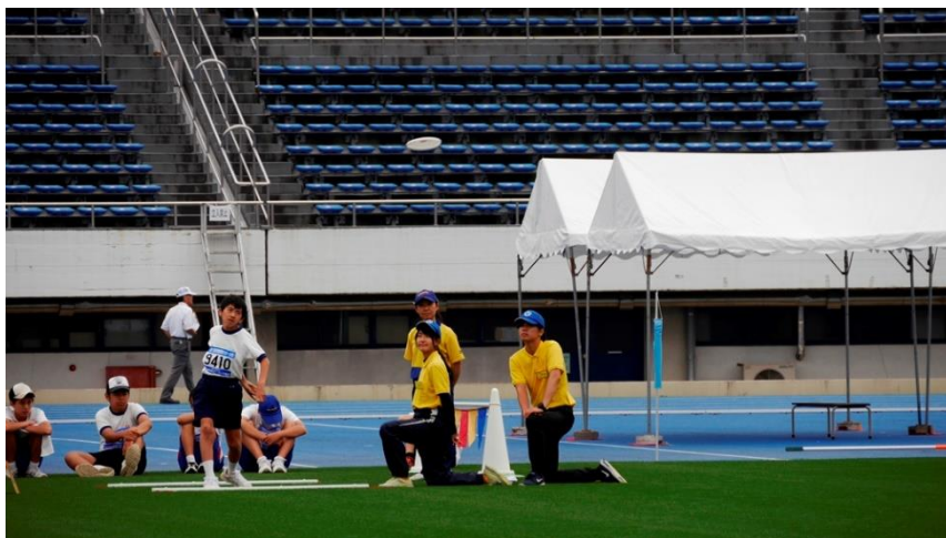
㉒フライングディスク ディスタンス 3回投げます。