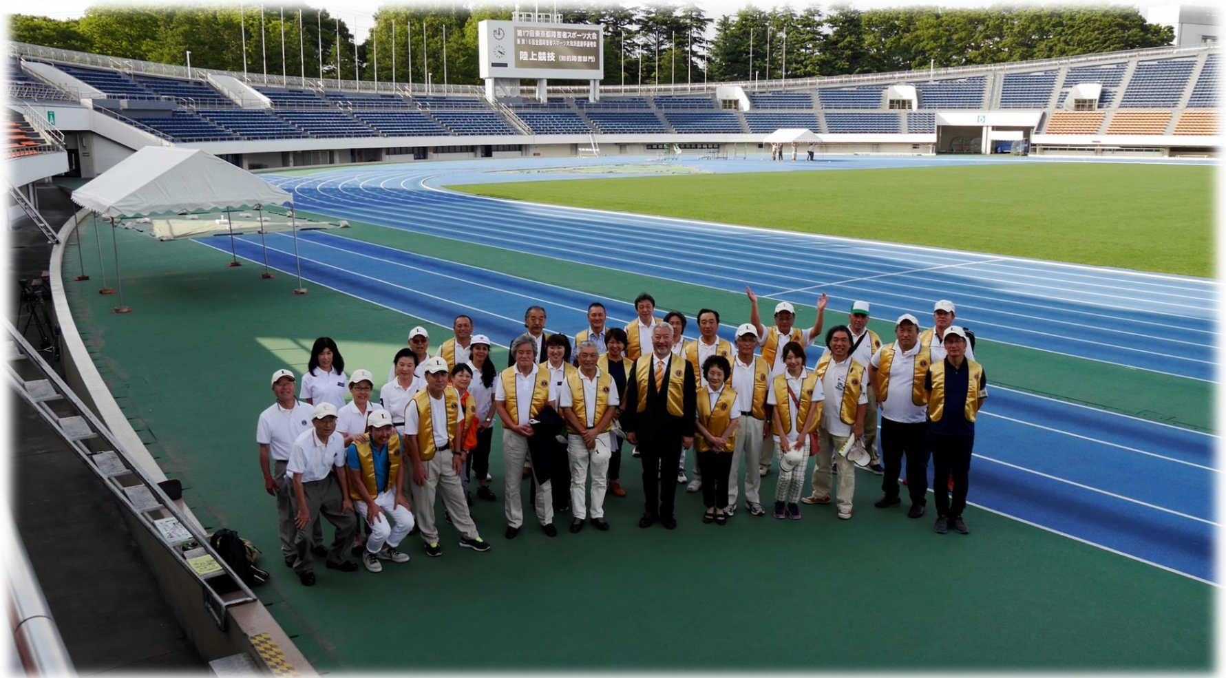
5.29. 記念撮影 (社会福祉・障がい者支援委員会+α)