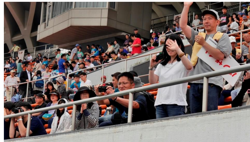
⑱雄姿の撮影は最前列