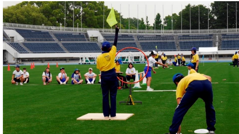
⑯サークルを通過しました、ポイントゲット。10回投げます。