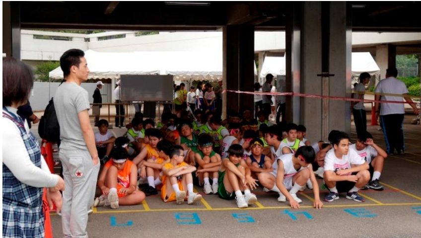
⑬召集所 もうすぐ出番です