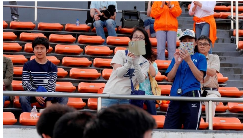
③④ スマホで撮影、すぐにシェアできます