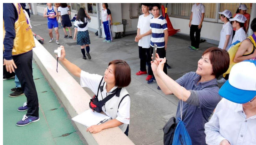
③⑥ ローアングルからの激写