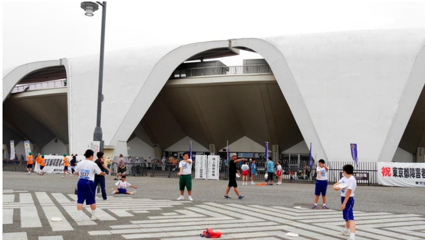
⑤メインエントランス