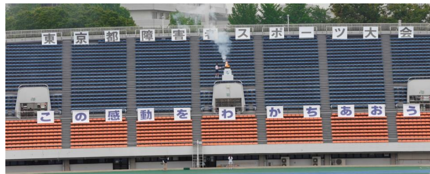
② ③ ④ 開会式の様