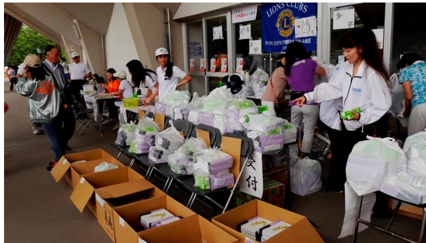
㉑お弁当仕分け準備整いました。