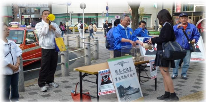
4.26.江戸川東、江戸川、江戸川なでしこLC