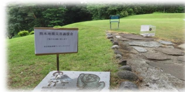
5.26.稲城多摩LC チャリティゴルフ