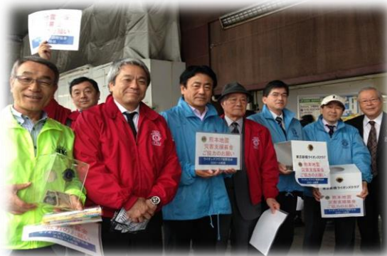
4.28.新橋LC + 3R1Z