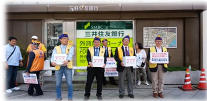
5.8. 6R1Z 合同 各クラブの募金活動写真集(順不同)