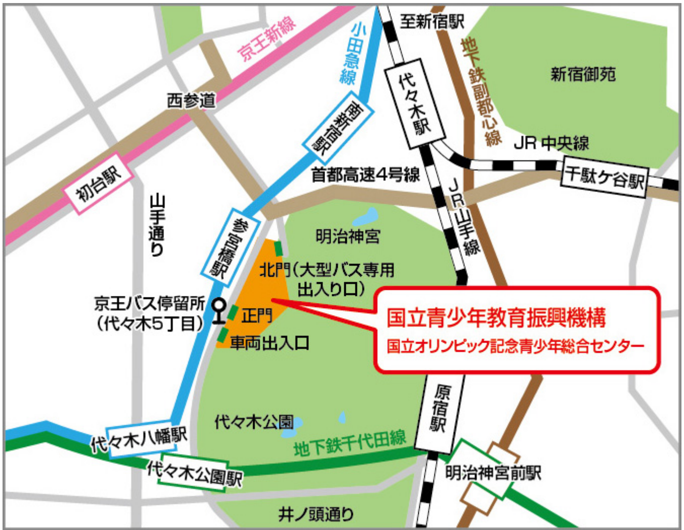
参宮橋からの[歩道橋]を使った経路