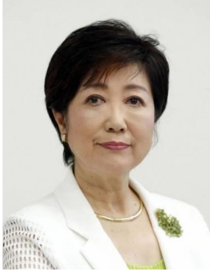
初の女性東京都知事 そして 東京Willライオンズクラブ会員 小池百合子氏