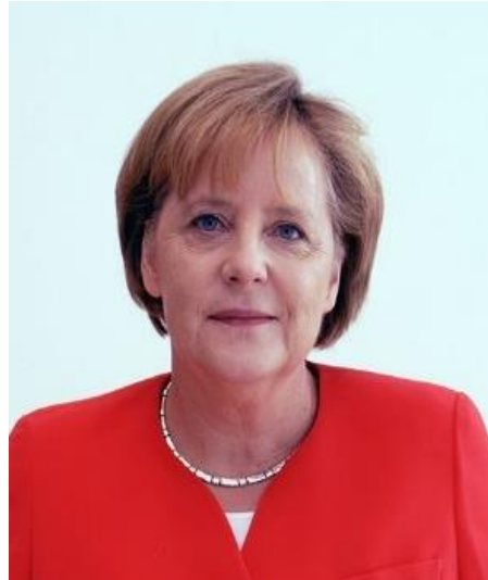
ドイツ アンゲラ・メルケ ル首相