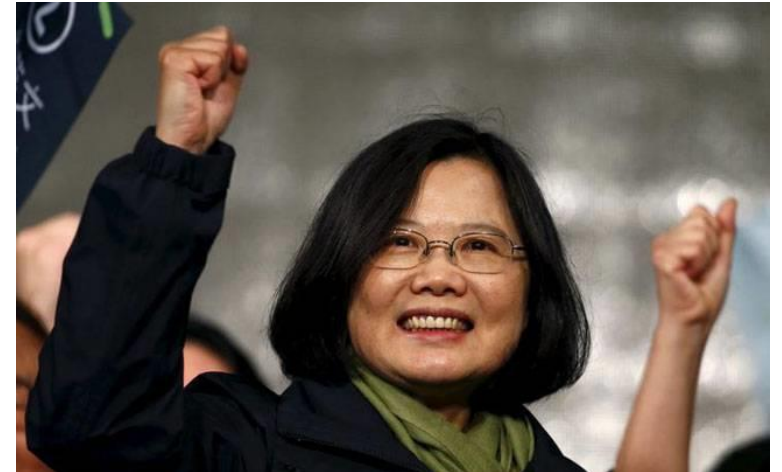
台湾 初の女性総統 蔡英文 (ツァイ・イン ウェン)