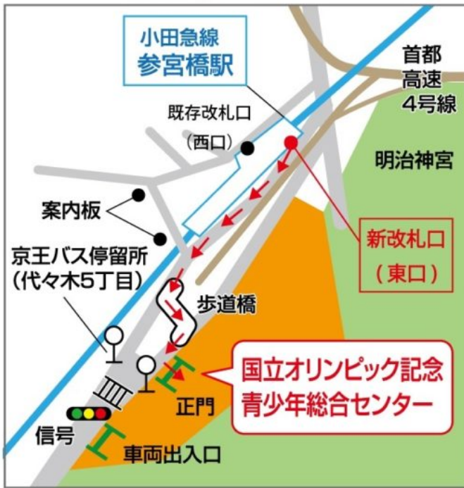
参宮橋からの【歩道橋】を使った経路