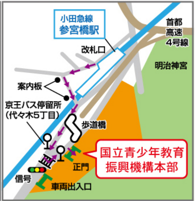
参宮橋からの【横断歩道】を使った経路