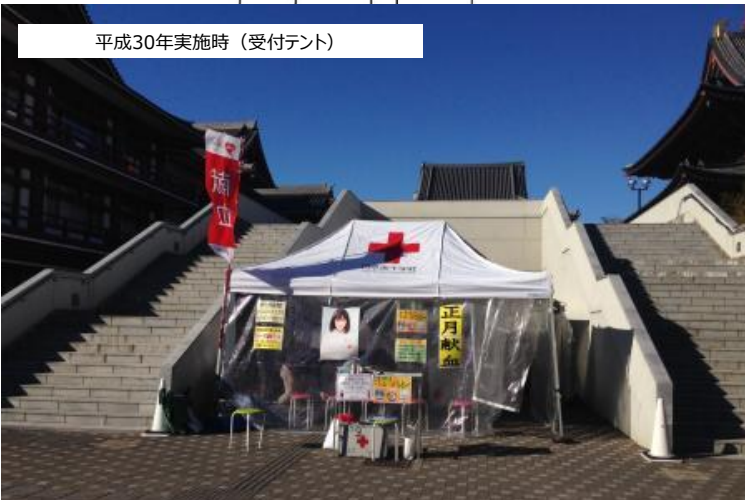
平成30年実施時 (受付テント)