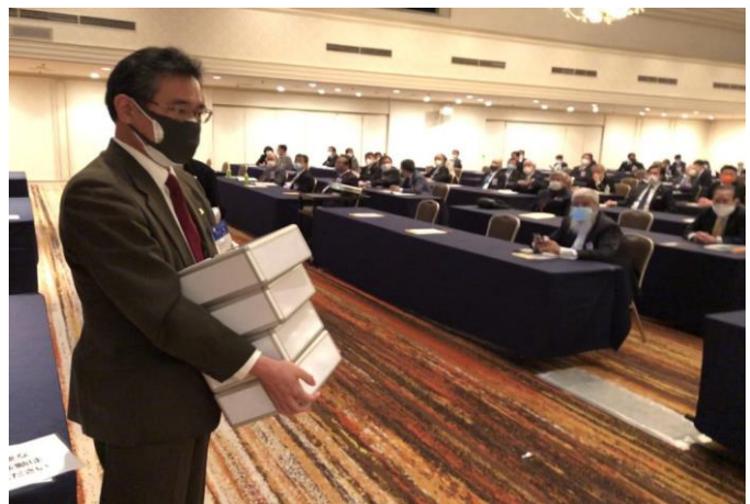
投票終了、集計作業へ(マグノリア)