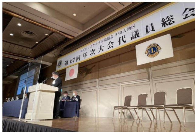
総会風景(鳳凰の間)